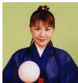
柳貴家小雪/大神楽